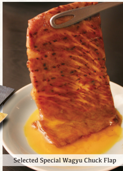
Selected Special Wagyu Chuck Flap